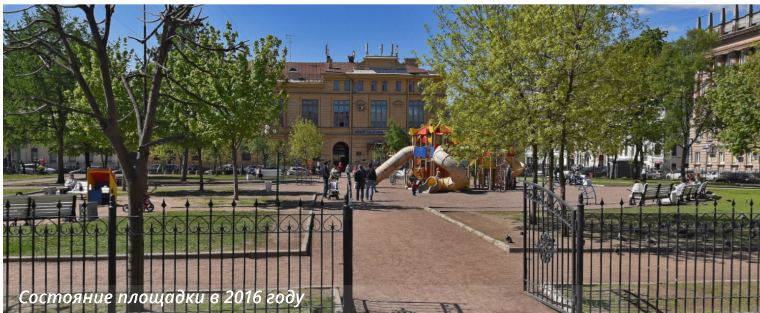
Состояние площадки в 2016 году