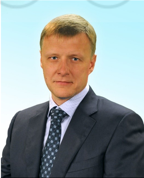
Депутат здорового человека